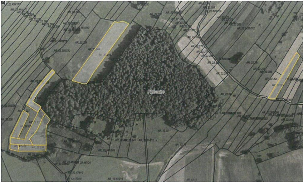
Rys. nr 1 Obszar przeznaczony do dzierżawy oznaczono kolorem żółtym

Zgodnie z danymi ujawnionymi w ewidencji gruntów i budynków, na powierzchnię działek przeznaczonych do dzierżawy składają się następujące użytki: